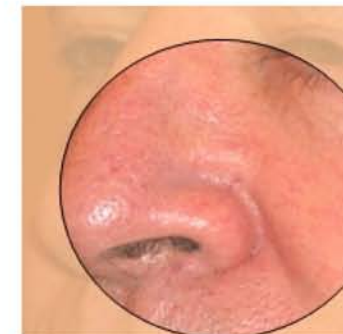
שבועיים אחרי סיום הטיפול